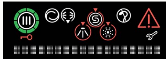
Gerät C: KD